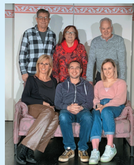
Lo staff dietro le quinte